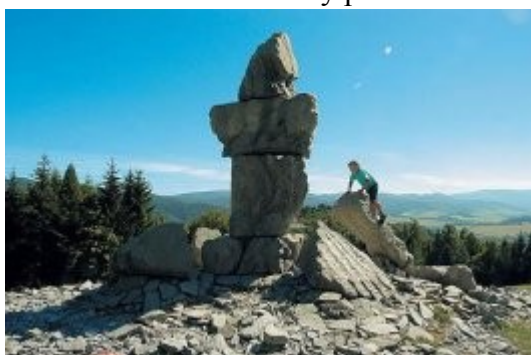
Lázně Jeseník - kamenná skulptura