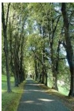
Lázně Jeseník - alej