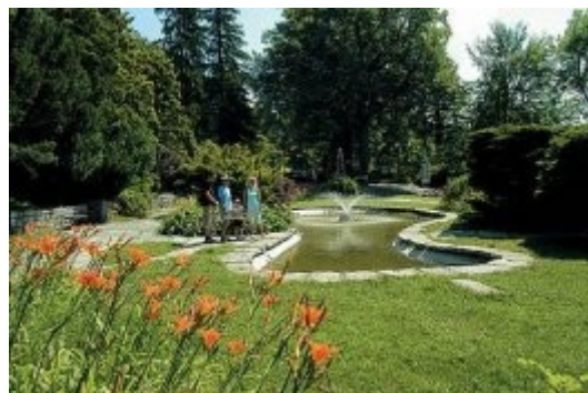
Lázně Jeseník - jezírko