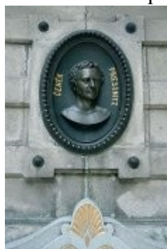
Lázně Jeseník - pamětní deska