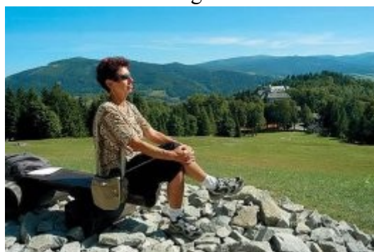
Lázně Jeseník - pohled na lázně