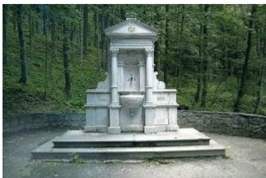
Lázně Jeseník - rumunský pramen