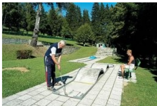
Lázně Jeseník - minigolf